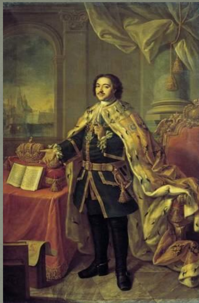
Антропов А.П. «Портрет Петра I» 1770г.