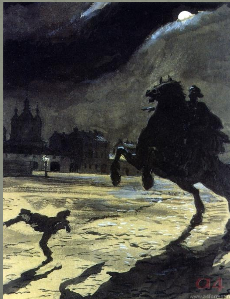
А.Бенуа «Медный всадник». «За ним несется Всадник Медный на звонко-скачущем коне». 1903–1922гг.